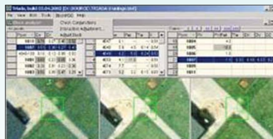
자동 향상 기능