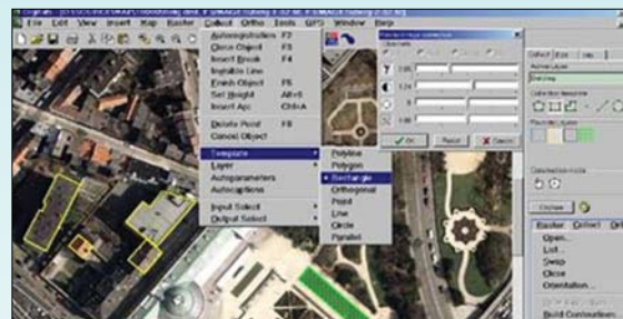
정사사진의 모자이크 기능